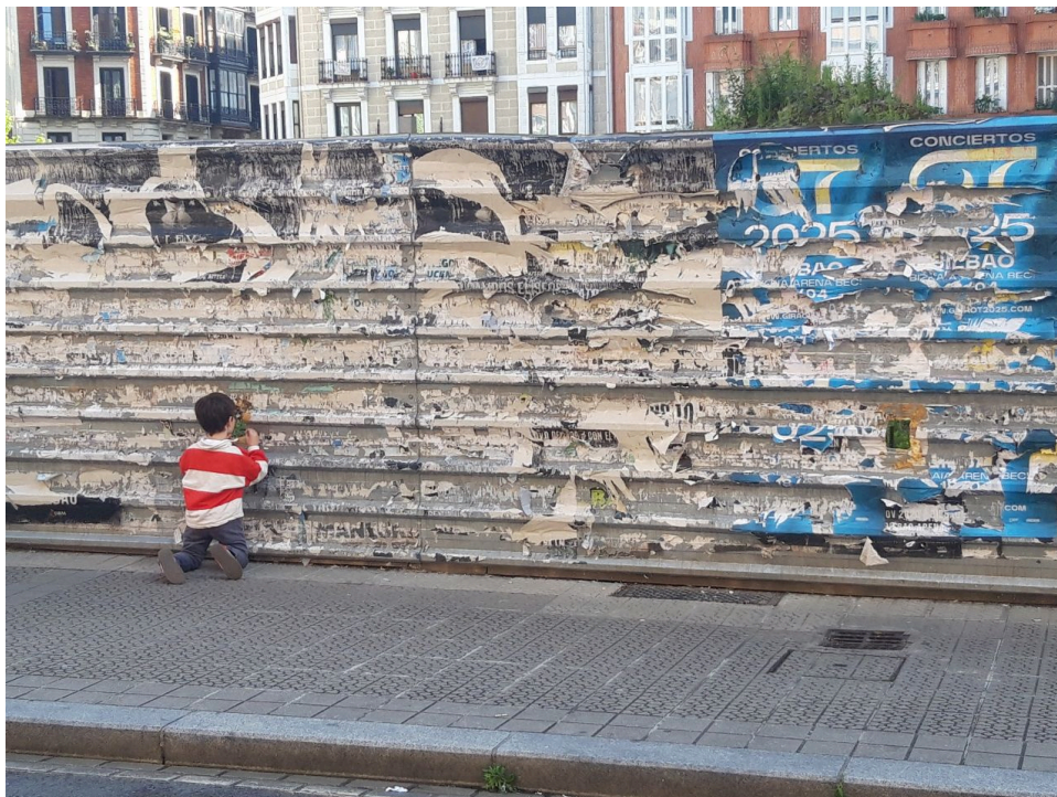
Niño jugando en agujero en valla de chapa con borde cortante.