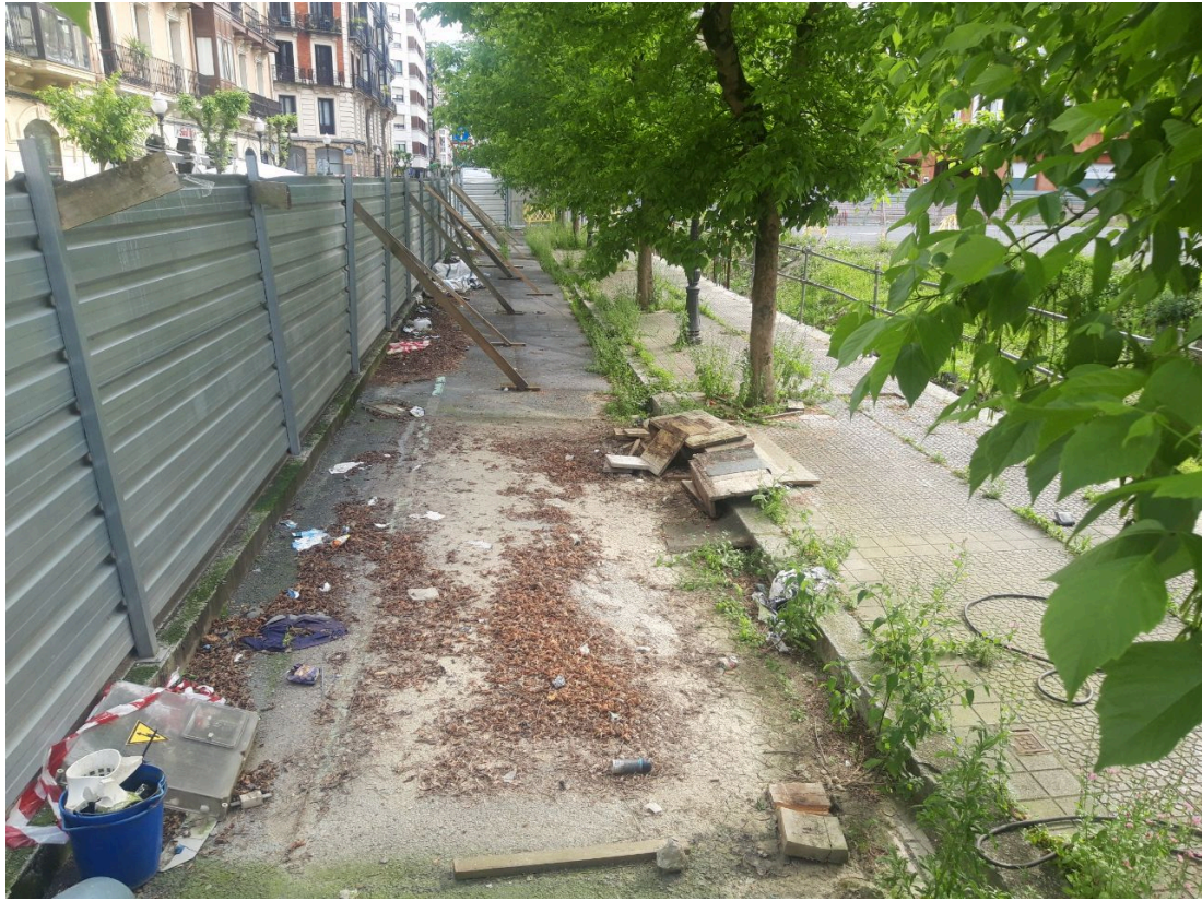
Zona de valla inestable: sin arriostramiento tras retirada de caseta de obra.