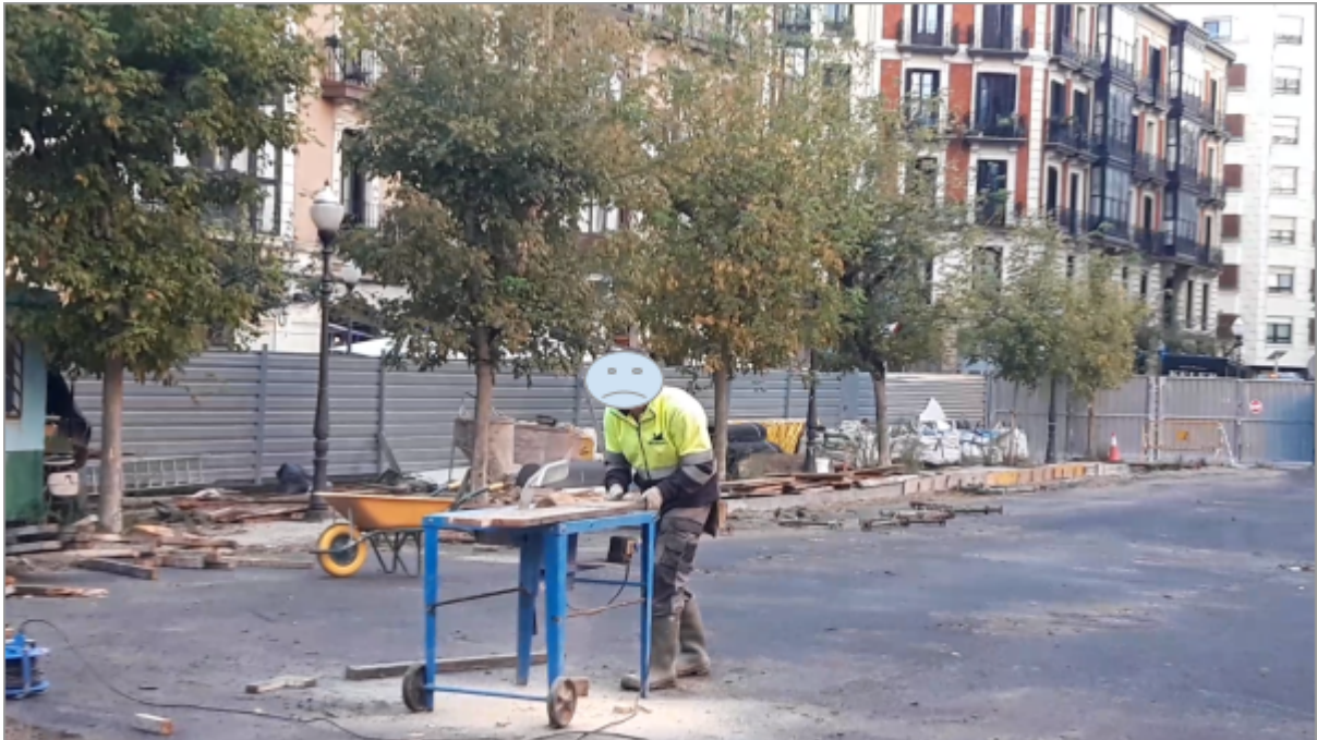
Trabajo manual sin apantallamiento a las. 9:30h del 24 de octubre de 2023.

La Asociación Vecinal Plataforma por un Abando Habitable y Saludable (CIF: G95962197) y domicilio a efectos de notificaciones en c/ Heros nº13 –2D 48009 Bilbao,