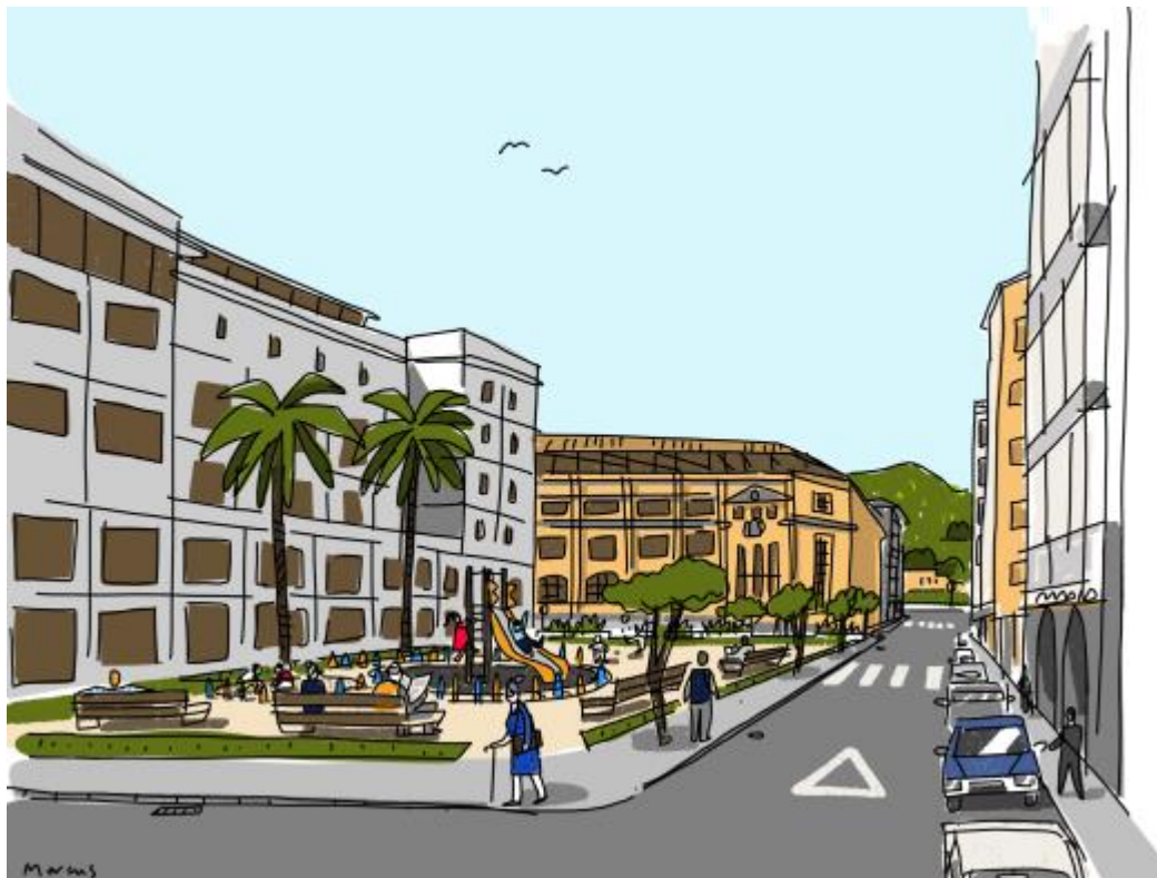
Propuesta de diseño si el patio de la escuela de Magisterio se convirtiera en espacio público.

Hace un año, la AMPA del Colegio Público Cervantes Ikastetxea tuvimos noticia a través de la prensa del proyecto de edificio Bizkeliza Etxea que la Diócesis de Bilbao quiere construir en la parcela donde actualmente está ubicada la Escuela Universitaria de Magisterio Begoñako Andra Mari. Como vecinos de la parcela, situada enfrente de nuestro colegio, nos preocupa mucho el futuro de esta edificación y cómo puede afectar a nuestra escuela.