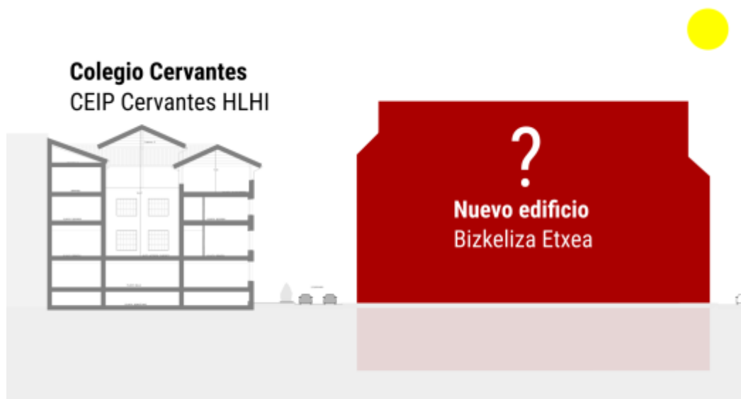
Esquema del nuevo edificio frente al Colegio (sección por la calle Lersundi).

planteado, cuenta con 6 plantas en la calle Lersundi, por lo que nuestra fachada se verá privada de sol y luz.