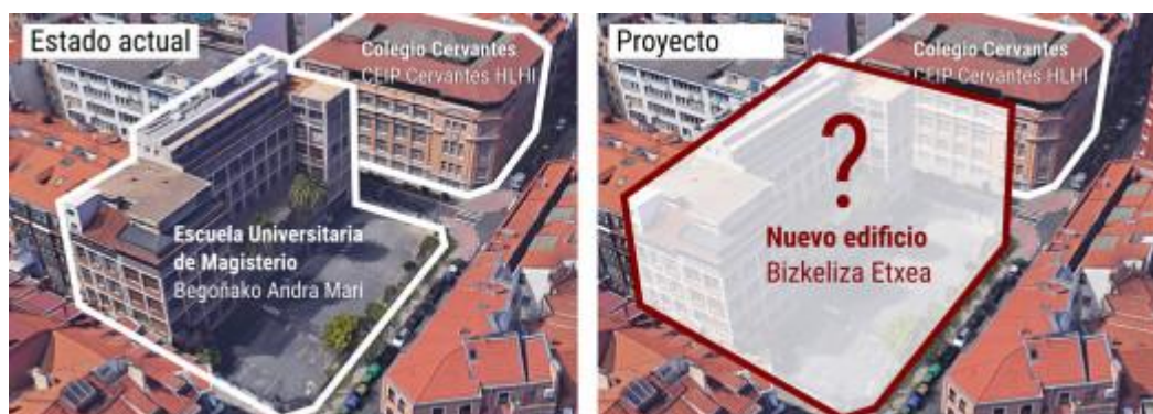
Estado actual y proyecto de construcción de Bizkeliza Etxea con Colegio Cervantes al fondo.

Hace un año, la AMPA del Colegio Público Cervantes Ikastetxea tuvimos noticia a través de la prensa del proyecto de edificio Bizkeliza Etxea que la Diócesis de Bilbao quiere construir en la parcela donde actualmente está ubicada la Escuela Universitaria de Magisterio Begoñako Andra Mari. Como vecinos de la parcela, situada enfrente de nuestro colegio, nos preocupa mucho el futuro de esta edificación y cómo puede afectar a nuestra escuela.