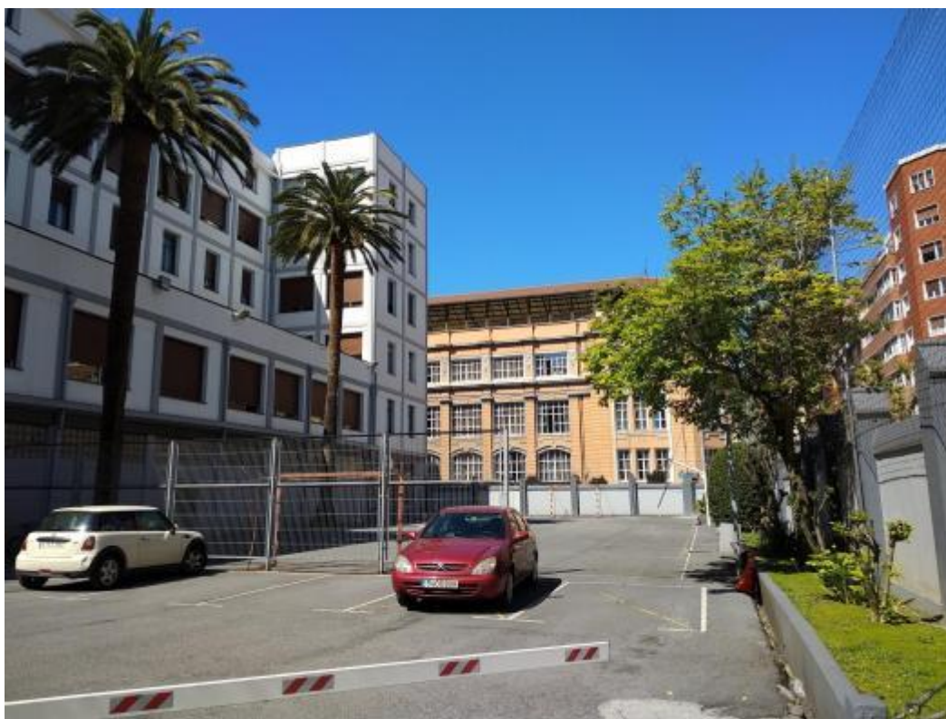
Vista del patio de la Escuela de Magisterio, con el Colegio Cervantes al fondo.

Además, nuestro Colegio no dispone de un lugar de encuentro próximo donde estar por las tardes a la salida de la escuela o por las mañanas antes de entrar, pues la acera de delante del Colegio no reúne condiciones para la estancia y el juego. Asimismo, el Colegio tiene carencias en cuanto a instalaciones de recreo adecuadas para los alumnos, ya que las existentes son espacios pequeños, y casi todos cubiertos y cerrados.